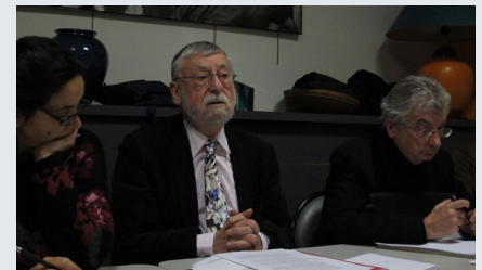
Le bureau de l'APCP lors de l'AG du 11 décembre.

A cet égard, la prise de position du Bureau national du Parti socialiste au printemps en faveur de cette création, l'acquiescement des autres formations politiques (constaté notamment lors du colloque du 13 juin à la Sorbonne), puis la décision prise par la ministre de la culture et de la communication en novembre de confier une mission d'expertise sur le sujet... autant d'avancées qui ont fait de 2013 une « année politique ».