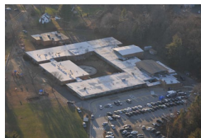
L'école de Sandy Hook à Newtown (Connecticut)

Le premier anniversaire de la tuerie de Newtown, petite ville de Nouvelle-Angleterre (20 enfants et 6 adultes y ont été massacrés en décembre 2012 dans l'école primaire de Sandy Hook) a donné lieu dans la presse américaine à interrogations déontologiques.